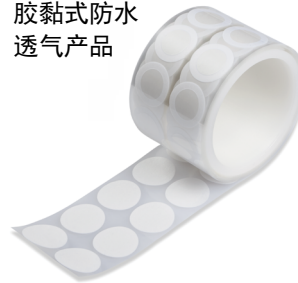
GORE®防水防尘透气产品 胶黏式防水 透气产品